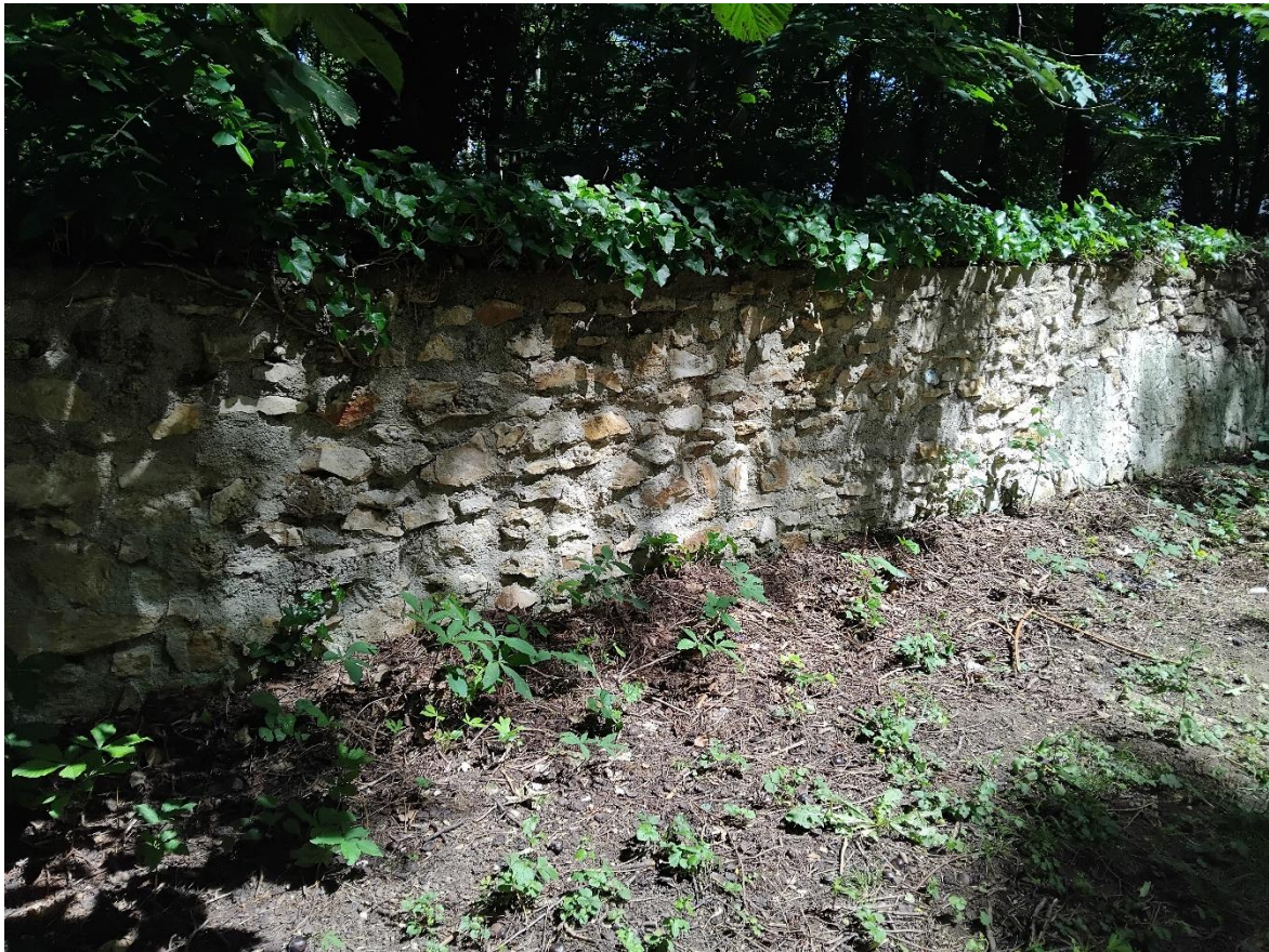
PHOTO 1 : Je suis née sur une terre aride, un caillou comme on dit. Rien n'y pousse tellement c'est désertique. Je décidai de plier bagage et de partir vers d'autres régions. Je ne connaissais rien à rien. Bien évidemment, avec mon incrédulité, j'étais persuadée que les différentes contrées se touchaient. Que nenni !

PHOTO 2 : Mon premier obstacle fut un mur. J'essayais d'en faire le tour, mais il était infini, pas de nord pas de sud. Bon je vais passer au-dessus.