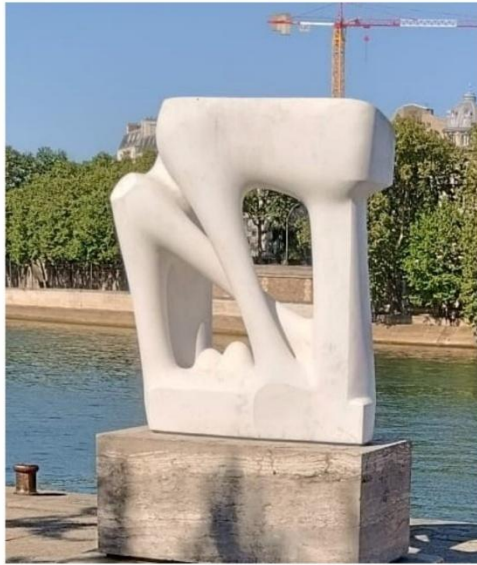
"La Grande Fenêtre" par Augustin Cárdenas.